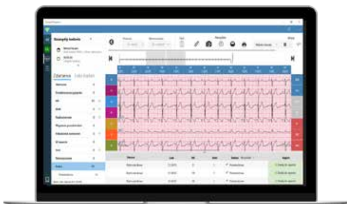
Aplikacja dla specjalistów