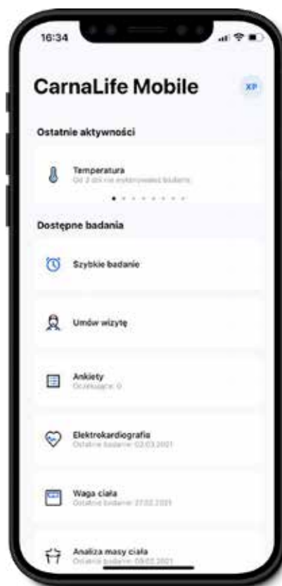
Aplikacja dla pacjentów